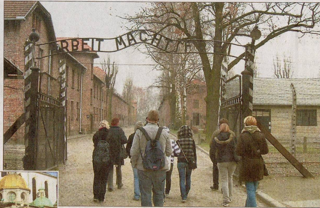
„Arbeit macht frei“: Der menschenverachtende wie zynische Spruch über dem Eingang des Konzentrationslagers. Die Besichtigung wühlte die Bad Salzdetfurthener Schüler auf.

die Lehrkräfte auch in ihrer Freizeit für das Anliegen des Projektes einsetzen. So wurde die Rallye zur Erkundung der Stadt Bochnia wieder mehrsprachig in gemischten Gruppen durchgeführt. Ein Lagerfeuer auf der Wiese eines Gastelternpaares mit Pizza, Spießwurstchen und Rätselspielen führte die Jugendlichen zum intensiven Austausch in englischer Sprache.