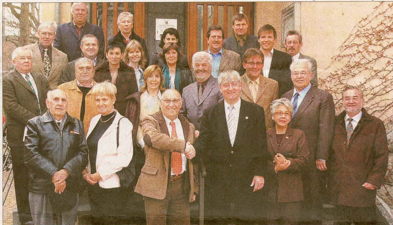
Die Stadt Bad Salzdetfurth hatte die offizielle Delegation aus Benicasim zu einem Arbeitsgespräch in das Rathaus eingeladen.