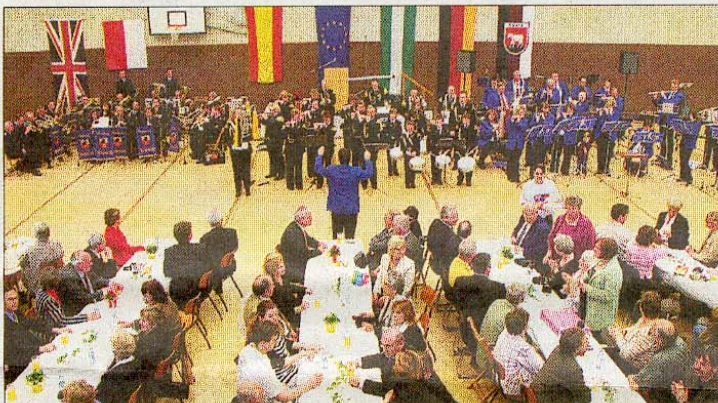
Mehrere Spielmannszüge sorgten für schwungvolle Musik.

Für schwungvolle Musik sorgten die Spielmannszüge Glück Auf und SV Eintracht sowie der MGV Eintracht und der Musikzug der Feuerwehr Wehrstedt. Tanzvorführungen rundeten das Programm ab.